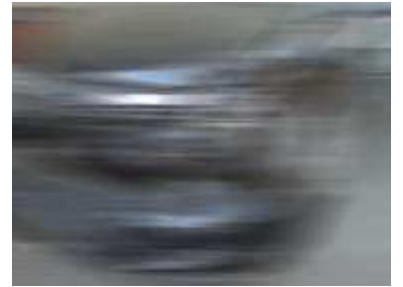
Unfall - halb so schlimm - wir bekommen es wieder hin.